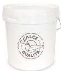
Sottofondo Secchio 25 kg