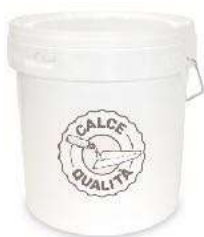
Aggrappo Secchio 25 kg