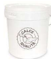
Pastina Secchio 20 kg