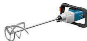
Mescolatore da trapano